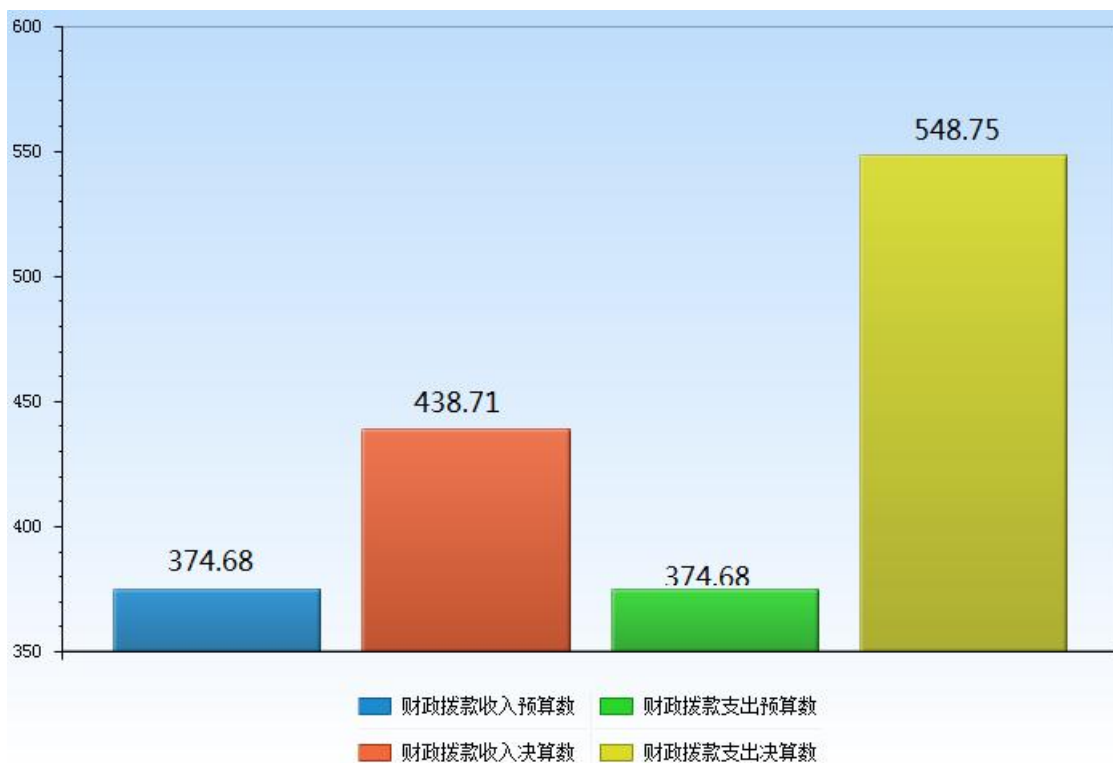
图 5：财政拨款收支预决算对比情况（单位：万元）