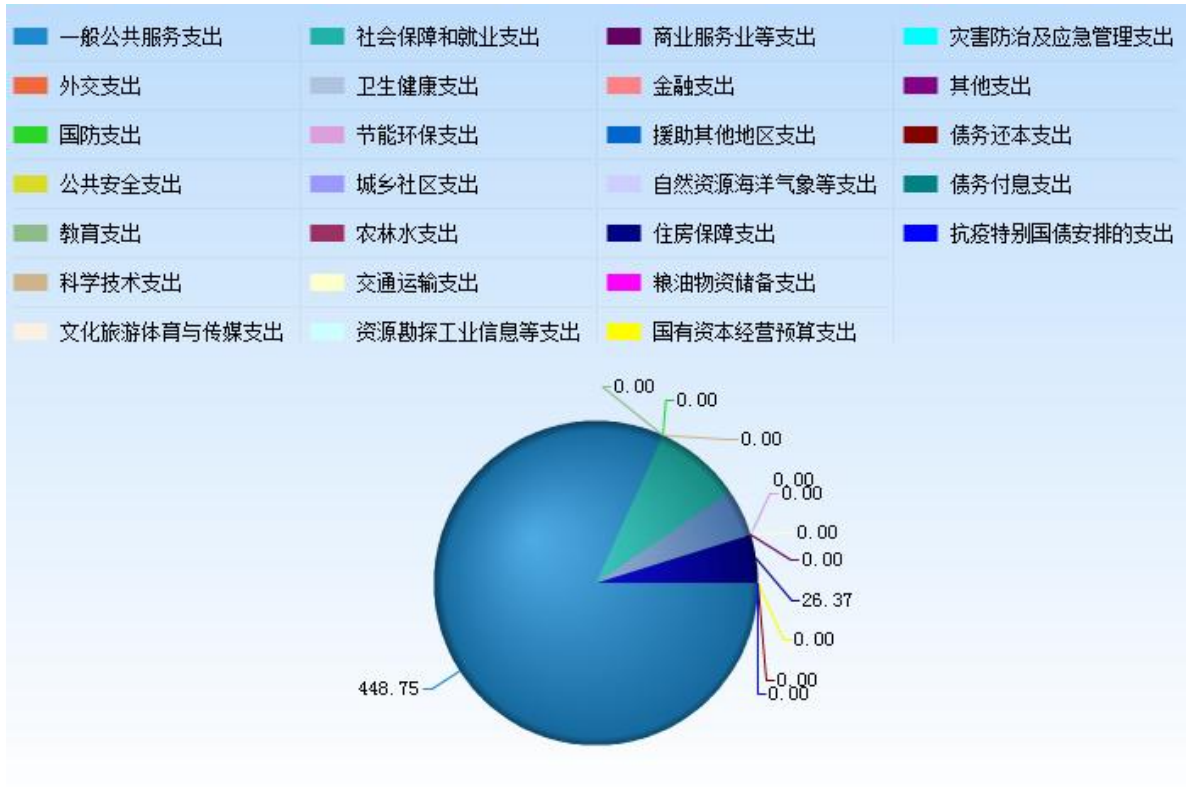
图 6：财政拨款支出决算结构（按功能分类）