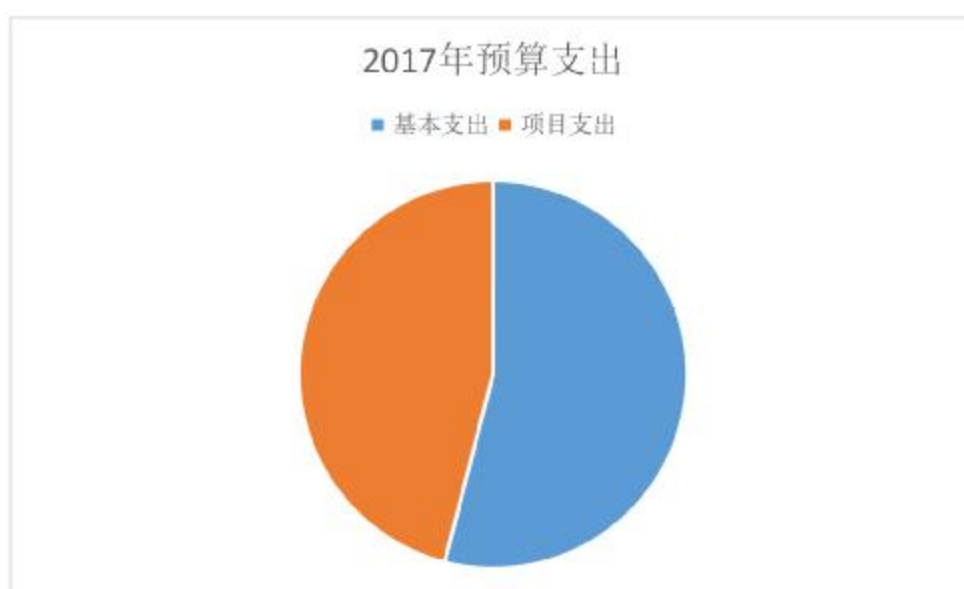
图 2：支出决算结构饼状图

本部门 2017 年度本年支出合计 1858.87 万元，其中：基本支出 1004.15 万元，占 54.02%；项目支出 854.72 万元，占 45.98%。如图所示：