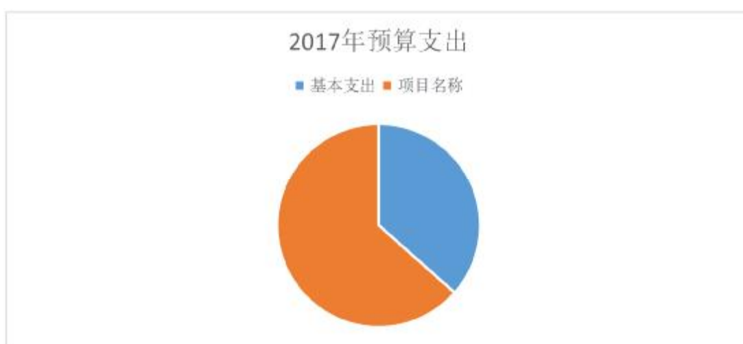
图 2：支出决算结构饼状图

本部门 2017 年度本年支出合计 19058.80 万元，其中：基本支出 6962.54 万元，占 36.53%；项目支出 12096.26 万元，占 63.47%。如图所示：